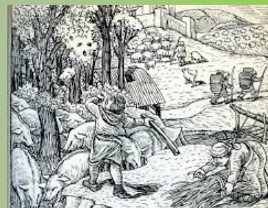
Usi civici nei dintorni del castello. La raccolta, la pastorizia.

Obiettivo del concorso è stimolare la narrazione e la memoria dei residenti relativamente alle modalità di gestione dei beni comuni: boschi, pascoli, acqua etc... Di interesse risultano tutti i racconti sulle forme di solidarietà attive, tempi e modi investiti per la gestione comunitaria dei beni di tutti, così come venivano risolti litigi e discussioni sulla divisione e gestione degli stessi.